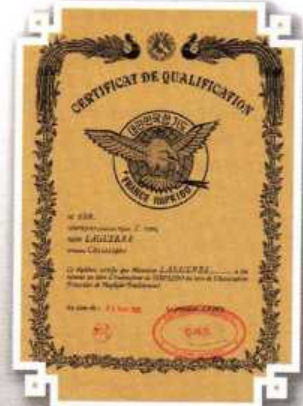
1992 - Dans ces années de découverte, une CN de Taekwondo pouvait avoir un DAN école de Hapkido après quelques stages. Certains, honnêtes ou réalistes n'en faisaient pas « un plat » d'autres, persévérèrent dans cette voie tortueuse pour obtenir encore plus de « Dans stages ».