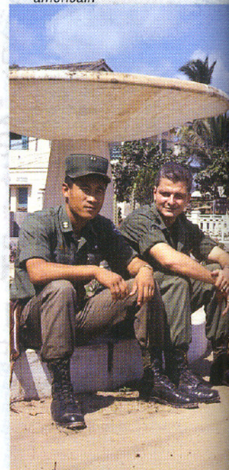
A Dalat en 1969 avec un camarade officier américain